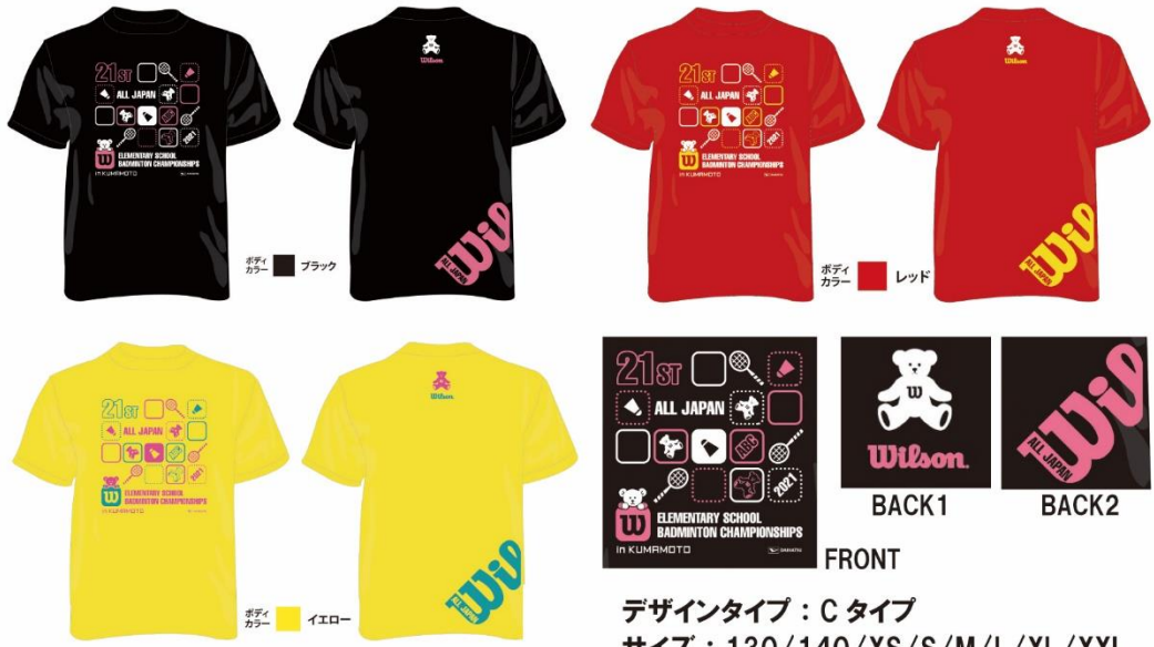
デザインタイプ：C タイプ サイズ：130/140/XS/S/M/L/XL/XXL 価格：2,800 円（税込）