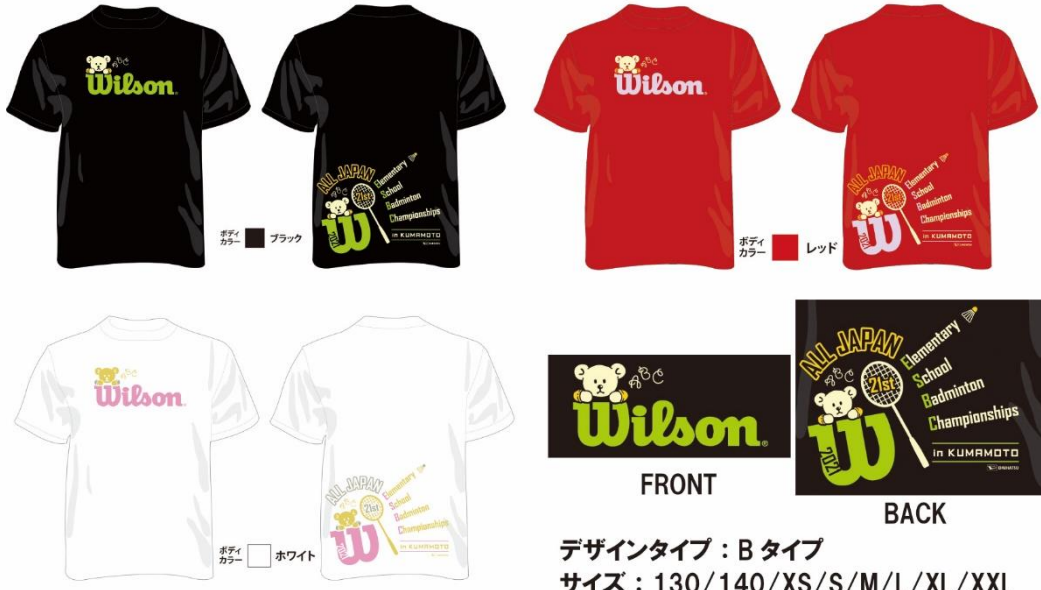
デザインタイプ：B タイプ サイズ：130/140/XS/S/M/L/XL/XXL 価格：2,800 円（税込）